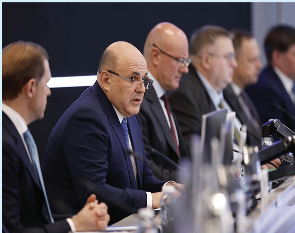
Михаил Мишустин считает, что система образования РФ должна стать более конкурентоспособной.

Первыми должны измениться крупнейшие технические и профильные вузы страны, считает глава правительства. Для этого необходимо переформатировать их основные направления рабо-